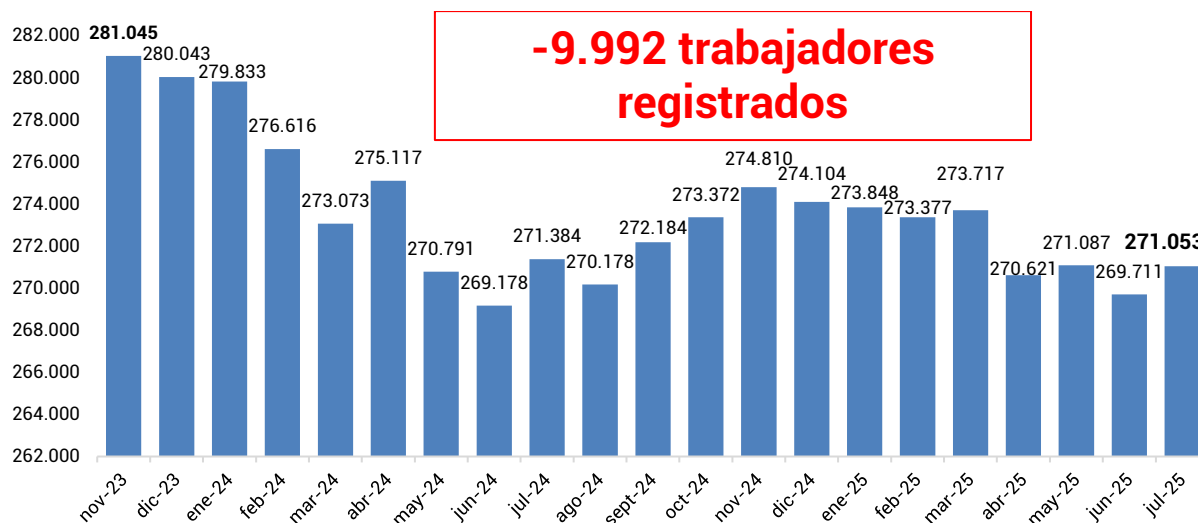
Gráfico 2. Evolución de la cantidad de trabajadores. Período: noviembre 2023 – julio 2025